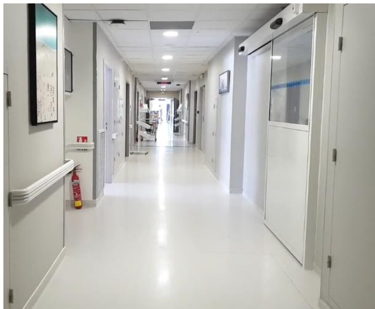
Entrée du service d'hospitalisation complète.