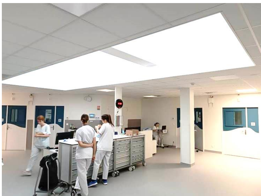
La zone centrale de la nouvelle USIC.