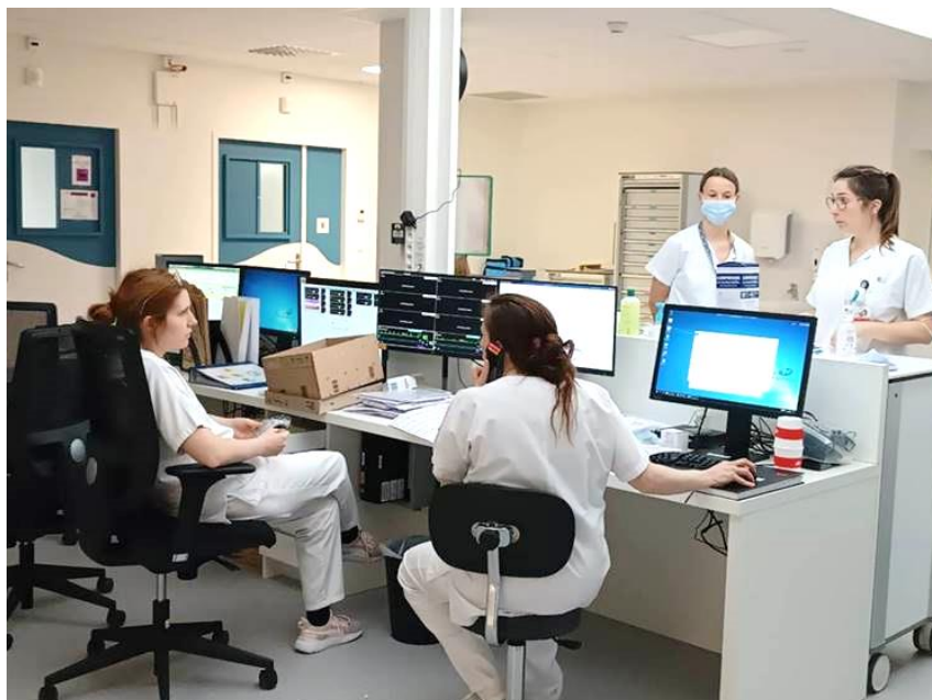
La zone centrale de la nouvelle USIC.